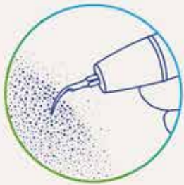
Καθαρισμός με υπερήχους χωρίς το Aerosol Reduction Gel