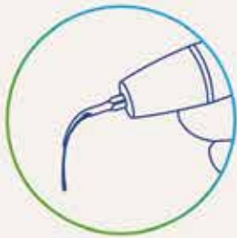
Καθαρισμός με υπερήχους με το Aerosol Reduction Gel

Λιγότερο αερόλυμα. Περισσότερη άνεση. Για σάς και τους ασθενείς σας.